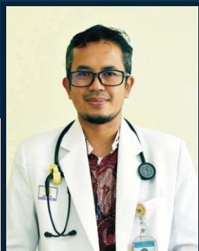
Yogyakarta, Desember 2019 Ketua Panitia,

Harapan kami melalui workshop dan simposium ini perkembangan-perkembangan baru di bidang kedokteran respirasi yang berhubungan dengan praktek dokter sehari-hari, baik itu masalah di paru dan terkait dengan ilmu lainnya sehingga dapat bermanfaat bagi semua peserta.